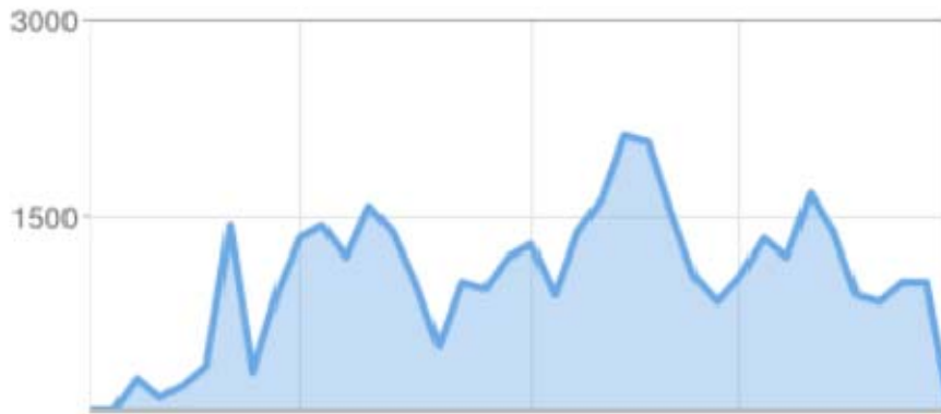
Estadística de http://patrimonioeducativo.blogspot.com.es/ desde su creación

Su carácter transnacional permite que tanto la bitácora como la web sean herramientas que nos permiten dar a conocer nuestro trabajo más allá de nuestro entorno inmediato: