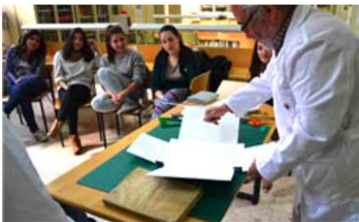
Agencia Estatal de Bibliotecas y Archivos para los alumnos de Artes del bachillerato